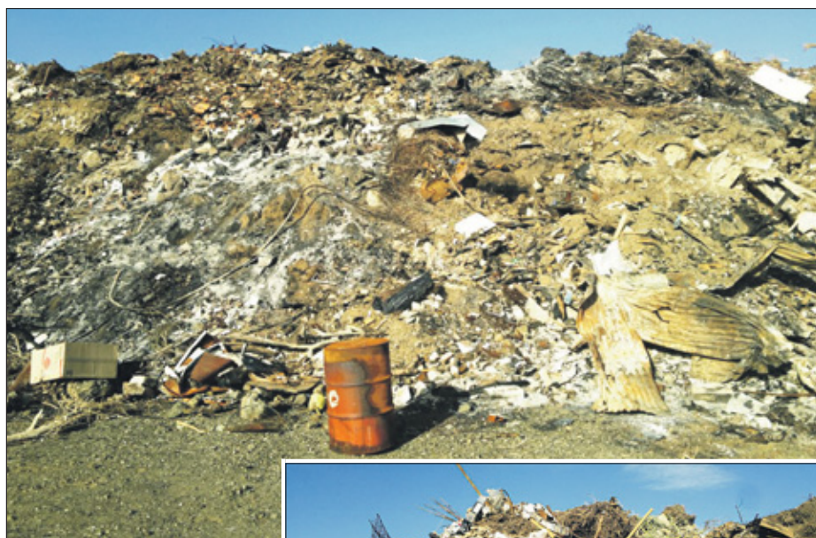
Er wordt nog altijd afval gedumpt en verbrand, aldus milieuorganisatie Green Force.

Behalve dat de volksgezondheid in gevaar komt is het volgens de organisatie ook nadelig voor het toerisme. Ook constateert de milieugroep dat er recentelijk door de regering dan wel is schoongemaakt, maar dat hier meteen weer is gedumpt en dat daar geen consequenties aan vast zitten. „Een slappe vertoning van een ministerie die dit