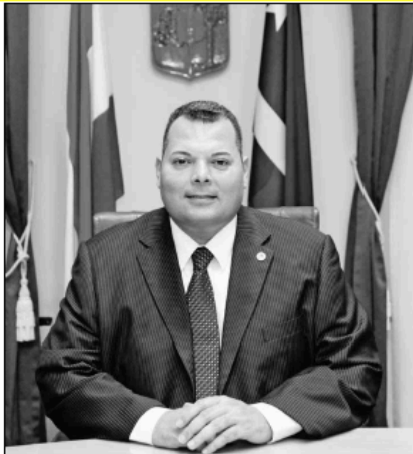
Premier Ivar Asjes, tevens minister van Algemene Zaken.