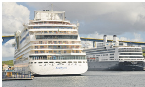
Twee cruiseschepen in de haven van Curaçao.

schepen in veel gevallen al goed is, maar met het onderzoek moet de veiligheid nog beter worden. Over achttien maanden moet het onderzoek worden opgeleverd aan de opdrachtgever