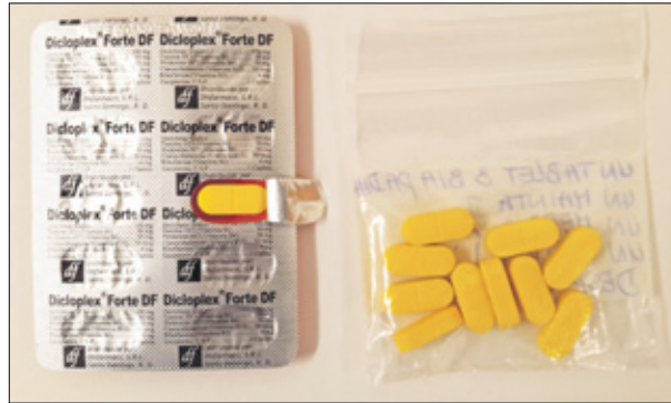
De tabletten worden uit de stripverpakking gehaald en in zakjes gedaan.

Omdat de tabletten van de illegale verkoop van Dicloplex Forte uit de stripverpakking worden gehaald en in ziplock-zakjes ter verkoop worden aangeboden, is de patiënt niet op de hoogte van wat hij daadwerkelijk inneemt. „Dit brengt grote risico's voor de gezondheid met zich mee. De bevolking van Curaçao wordt daarom dringend aangeraden om het geneesmiddel Dicloplex Forte niet te kopen noch