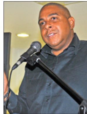
Minister Earl Balborda.

Raadsman Bonapart wacht het af. Een nieuwe exploitant van de Boogjes zou volgens hem pas nadat de regering mogelijk een deal sluit met de huidige exploitant, aan de slag kunnen gaan. Minister Earl Balborda was zowel gisteren als zondag niet bereikbaar voor commentaar.